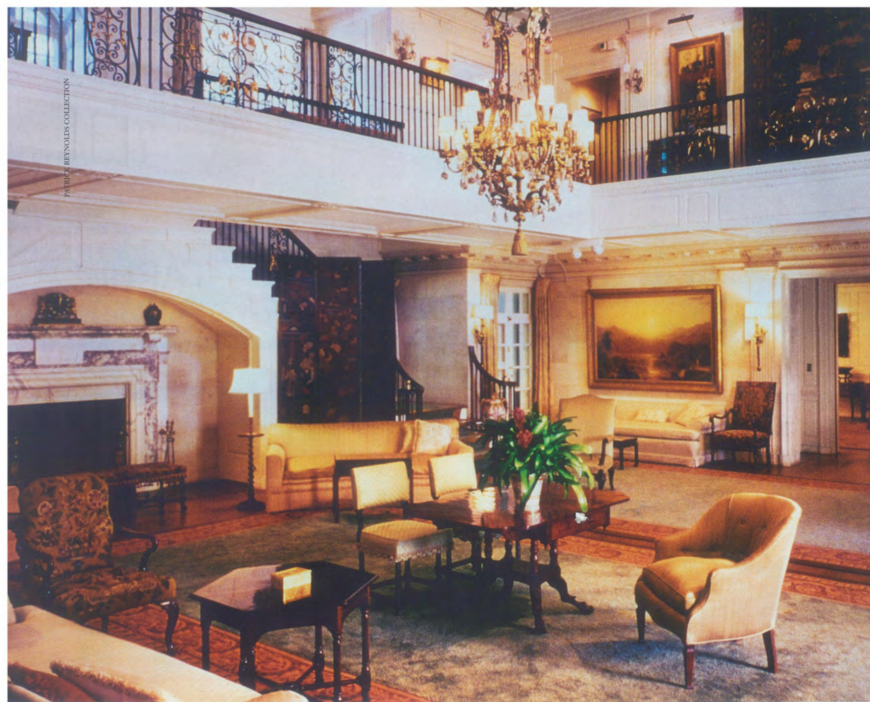
Интерьер гостиной в поместье «Рэйнолда», остров Сапело

выискивал при помощи частных детективов в Париже, Лондоне и Майами, и та снисходительно позволяла ему составить себе компанию. Он писал ей длинные любовные письма, а она сводила его с ума — своими отказами, насмешками, своими романами — с мужчинами и, что ранило большее, с женщинами. При этом Либби держала его на коротком поводке: на дворе была Великая депрессия, количество зрителей на мюзиклах таяло, новая главная роль на горизонте пока не вырисовывалась — Смит был ее страховкой, ее гарантийным талоном. В конце концов, он молчалив, но мил, совсем неглуп и так богат... Постепенно она к нему привыкла. «Он как пустыня, из которой время от времени бьет гейзер», — говорила Либби подругам. Смит был очень настойчив, угрожал, что застрелится, если она не будет его, обещал, что станет известен на весь мир, развелся ради нее с Энн — и в конце концов она сдалась: в ноябре 1931-го они поженились. И, чтобы доказать, что он не пустышка, Смит решил на невероятный шаг — облететь вокруг Земли на самолете.