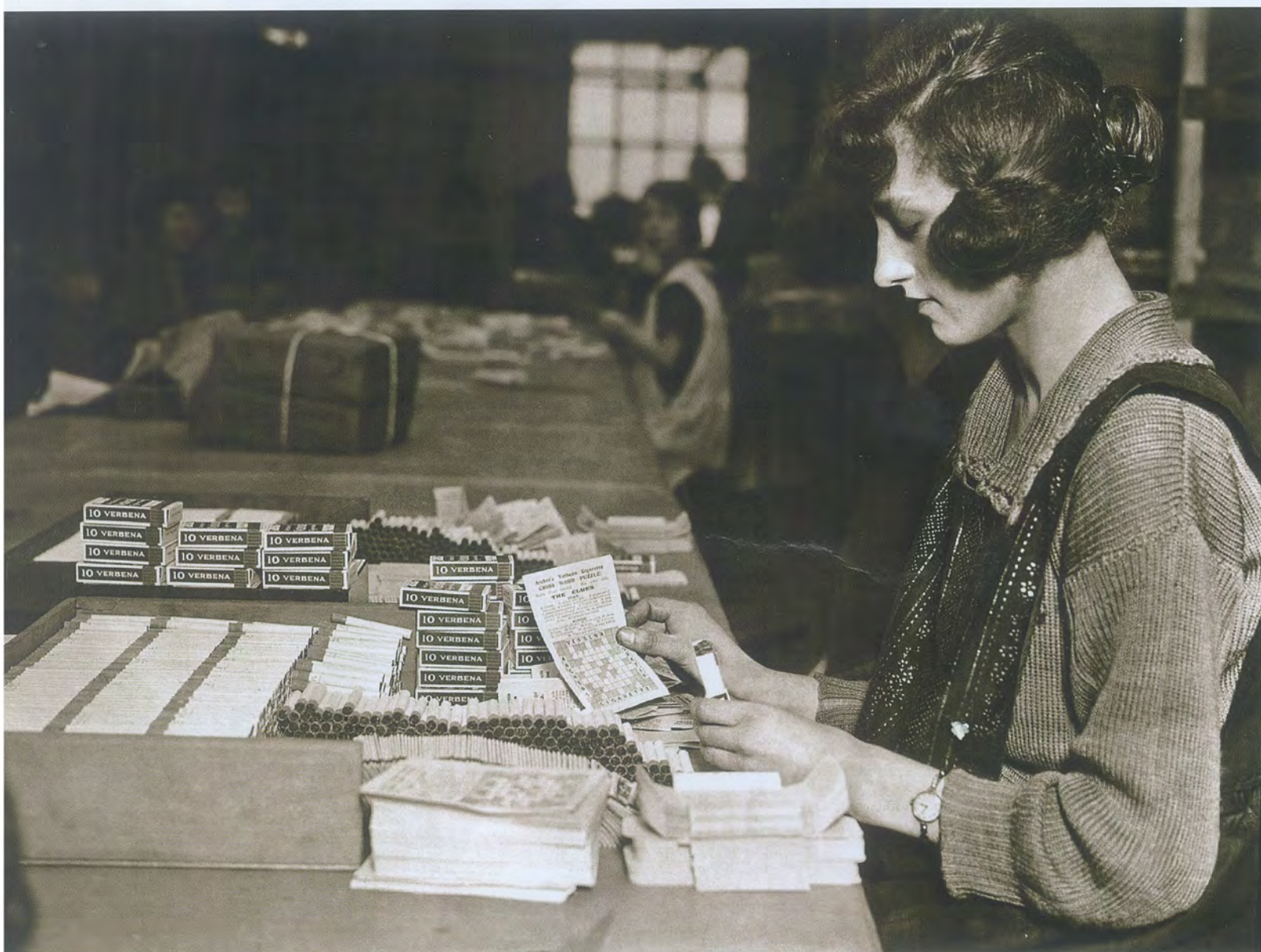
Конкуренты Ричарда Рэйнольдса по его примеру вкладывали в пачки сигарет кроссворды и подарочные купоны